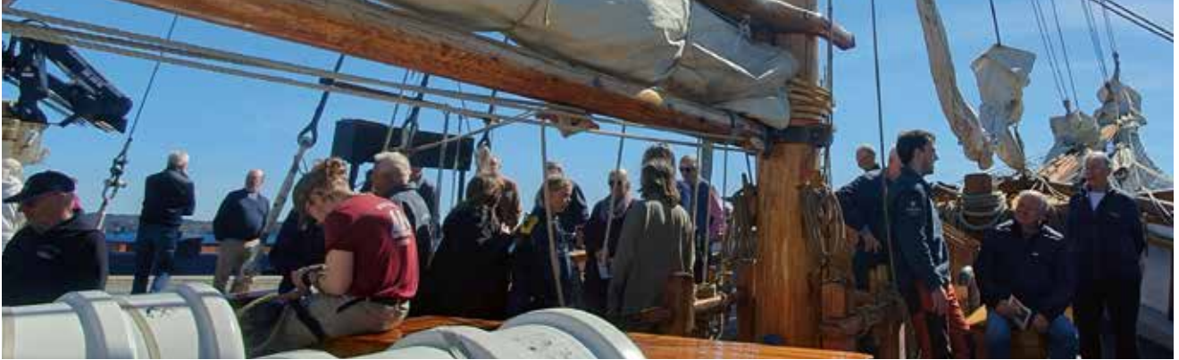
Besök på T/S Kvarnsita vid Museidagar 2025.

För en ringa kostnad får du tillgång till ett omfattande nätverk, synas i Museiguide kostnadsfritt, delta på Museidagar och gratis rådgivning. Dessutom bidrar du till att värna, utveckla och synliggöra industrisamhällets kulturarv.