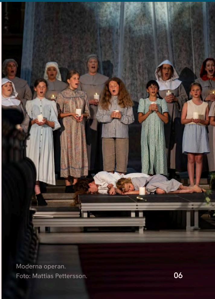
Moderna operan.