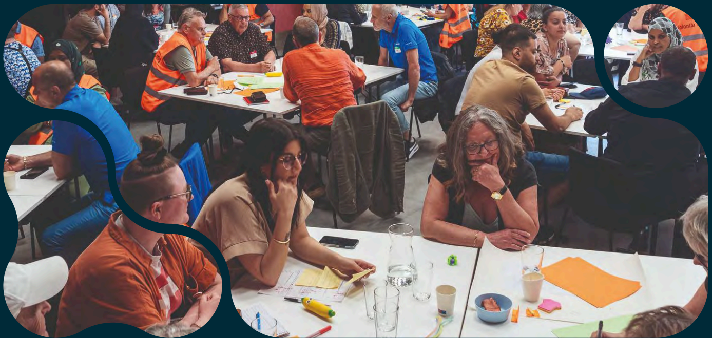
Birkagårdens Folkets hus.

Organisationsstödet är grunden till att kunna ha ett kansli. Tack vare kansliet finns en kontinuitet som gör det möjligt att genomföra kurser, mässor, samordna frågor, producera en katalog, skapa samarbeten och nätverk.”