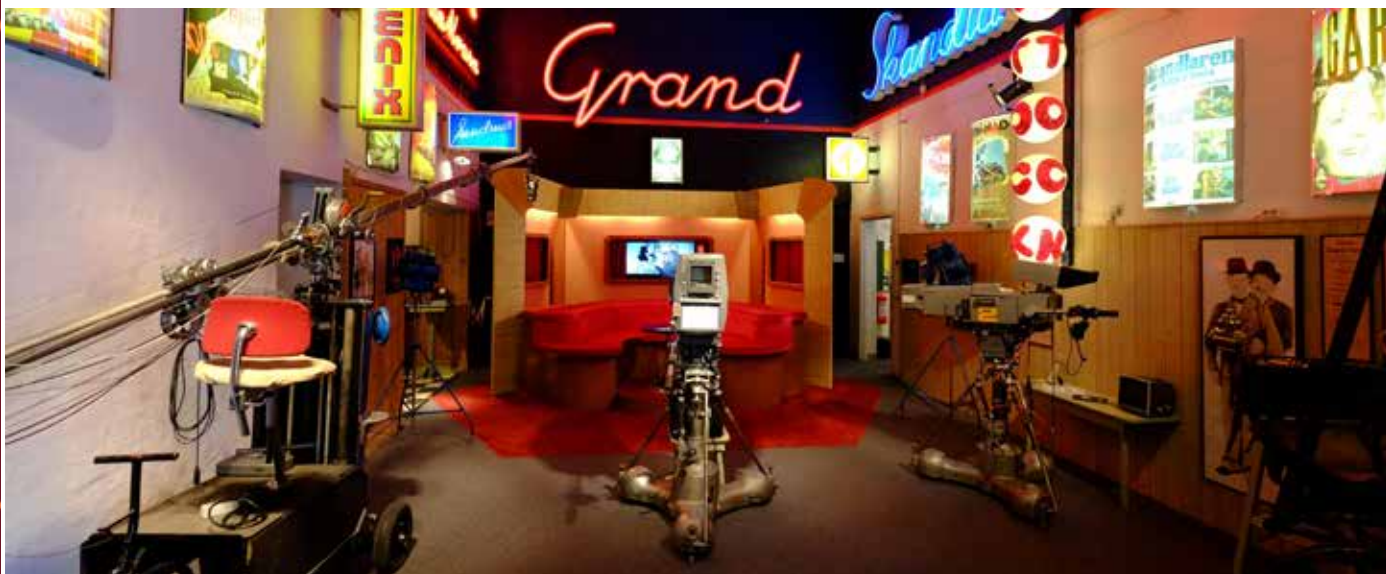
Sätters Biograf & TV-museum