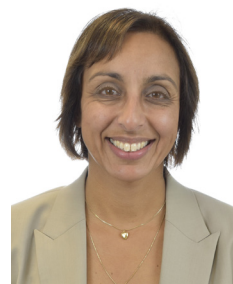
Invigningstal av Louise Thunström (S), kulturutskottet Sveriges riksdag