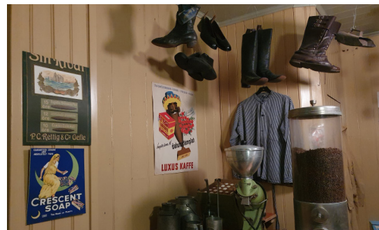
Foto: Lovisa Almborg CC-BY förutom Parisa Liljestrand av Johannes Frandsen Regeringskansliet samt Örebro Medicinhistoriska Museum av Anders Nydahl.

Bilder sid 2: Persedelförrådet, Sannahed friluftss- och militärområde, Stenarbetmuseet Yxhult, Wadköping och Örebro Medicinhistoriska Museum.